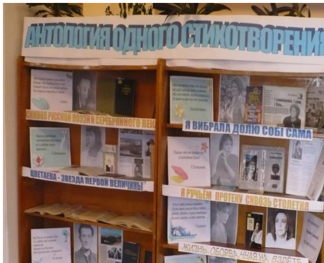
Рис.1. Книжная выставка «Антология одного стихотворения»