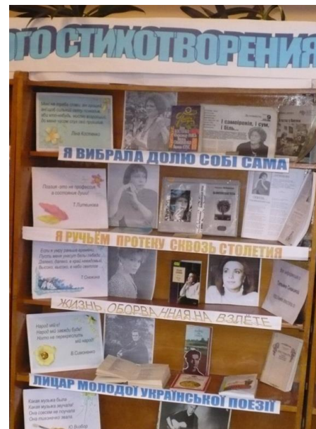
Рис.2. Фрагмент книжной выставки «Антология одного стихотворения»