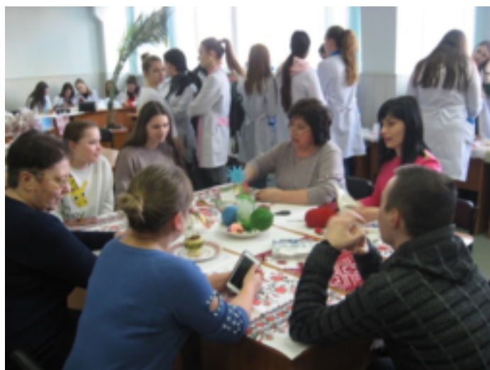
Майстер-клас з виготовлення мотанки до свята Масляна