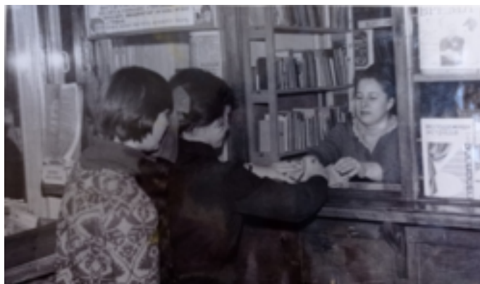
Бібліотека Харківського хіміко-механічного технікуму 1980-х рр.