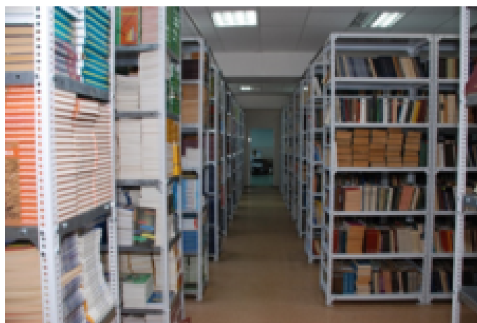
Книгосховище відділу обслуговування науковою та навчальною літературою Національного фармацевтичного університету (2006 р.)