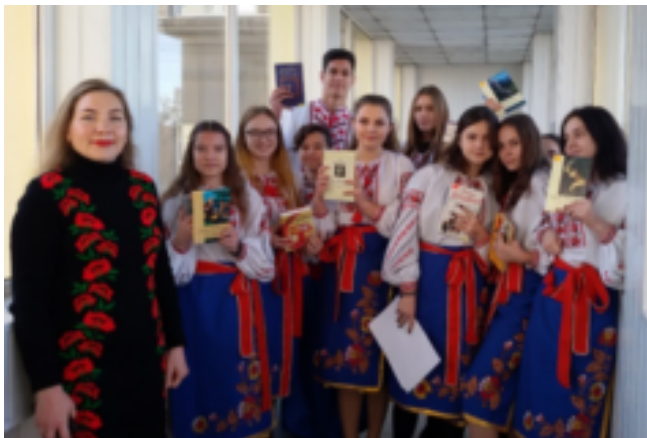
Флешмоб «Люби своє - читай українське»

Для популяризації бібліотечних фондів, відзначення знаменних і ювілейних дат відділ обслуговування гуманітарною та економічною літературою проводить різноманітні культурно-просвітницькі заходи: книжкові виставки, бесіди, диспути, відкриті перегляди літератури. Серед новітніх форм культурно-просвітницької діяльності активно використовуються години історичної пам'яті, презентації книг, акції, книжкові інсталяції, флешмоби та багато інших форм, які добре зарекомендували себе на протязі багатьох років. Найбільш поширеними є тематичні виставки, які формують основні засади громадянського, морального, правового та художньо-естетичного виховання.