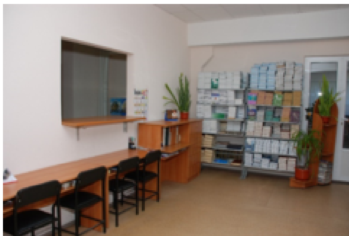
Абонемент відділу обслуговування науковою та навчальною літературою Національного фармацевтичного університету (2006 р.)