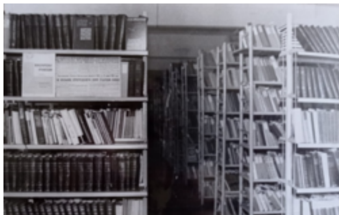
Бібліотека Харківського хіміко-механічного технікуму 1970-х рр.