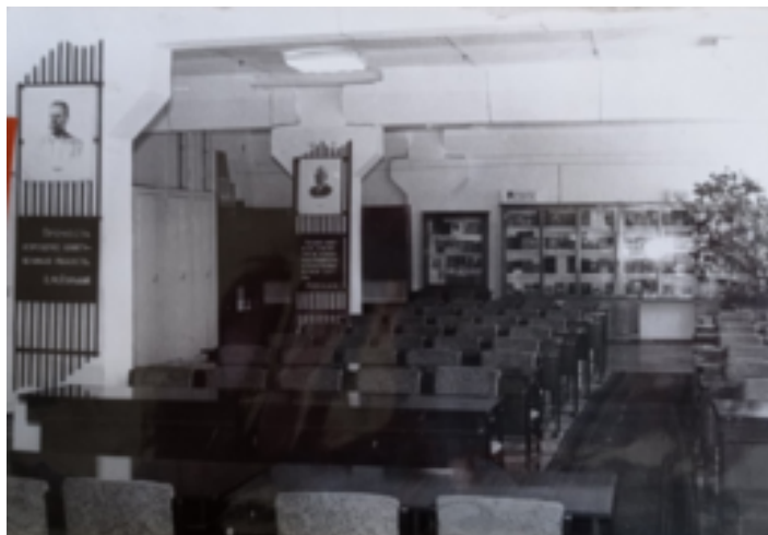
Бібліотека технікуму Української фармацевтичної академії 1997 р.