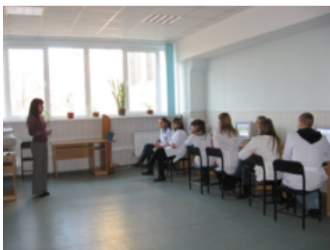
Електронний читальний зал відділу обслуговування науковою та навчальною літературою Національного фармацевтичного університету (2006 р.)